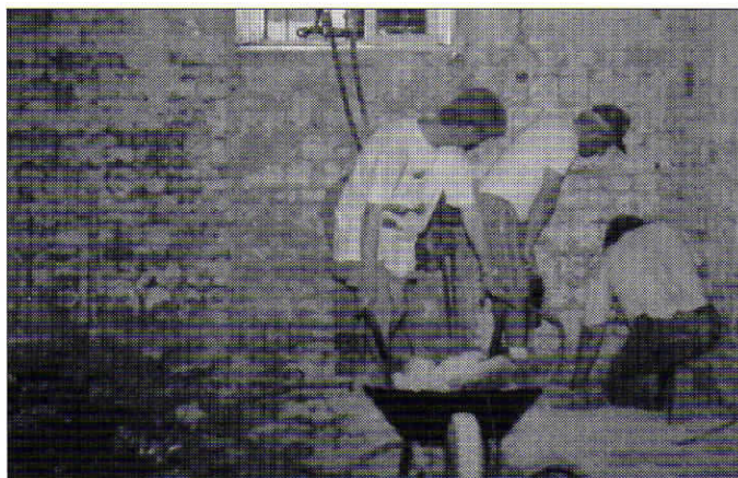
Egy alagsori tanterem kialakításának kezdő pillanataiból..

4. A tanárok többsége változatlanul mindkét tagozaton tanított.