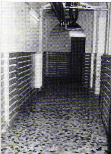
Az átalakított alagsor akár orvosi várónak is beillene...

9.4. A folyamatos munka során a legnagyobb gondot az ütemtervek és a