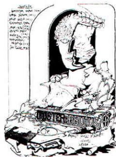
A Radnóti Miklós Kísérleti Színház Brutus című darab bemutatója és plakátja