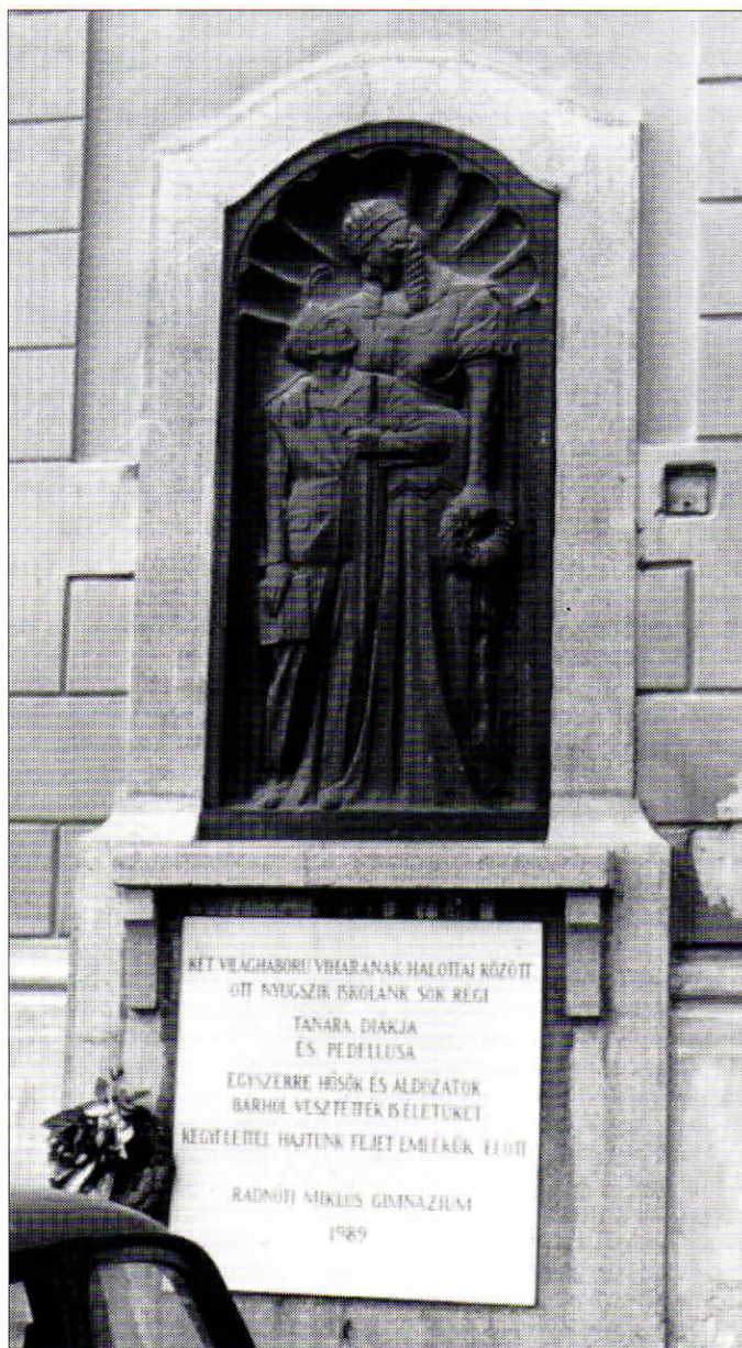
Az átalakítások szünetében arra is futotta az iskola erejéből, hogy a korábbi udvari bőszi emlékművet felújítsa. Igazolása az évszám: 1989.