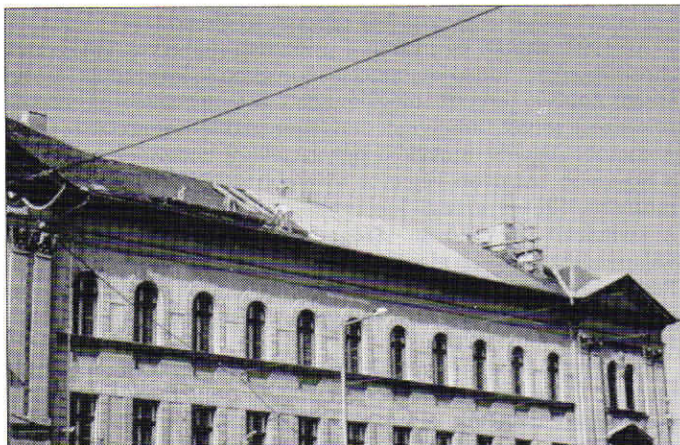
Az 1997-es cserepezés

zásra kialakított 2 kisterem, a 2 nem nyelvi, a 3 nyelvi laboratórium, az 1 rajzterem és a 2 könyvtárhelyiség. Az apróbb változások az első emelet rajzát figyelve jól követhetők (1. E2 1994): a 46., 47. sz. szertár, illetve nyelvi labor helyén van ma a gazdasági iroda és egy osztályterem; a hosszabbik szárny parányi volt gondnoki szobája, ma tanári dohányzó.