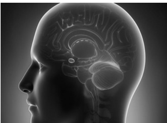
Agyi mandulamag egyik párja