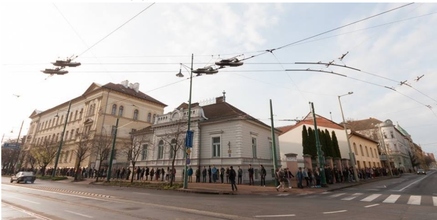
Fotó: Szajbély Zsigmond 11. M